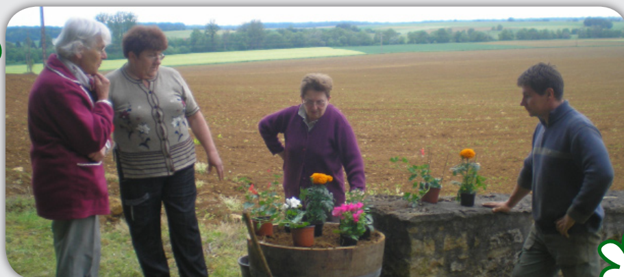
Le fleurissement de la commune

D'après la préfecture, le maire et son adjoint restent élus.